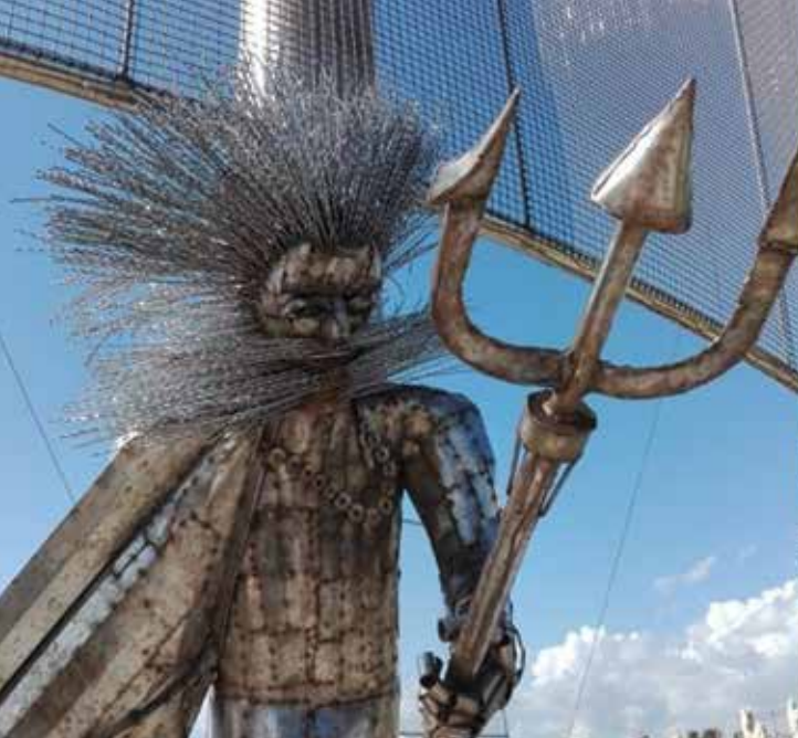
Αριστερά: Πάρκο Γλυπτικής Αγία Νάπα-Κύπρος Δεξιά: Trieste- Ιταλία, Άγαλμα του Ποσειδώνα σε πηγή