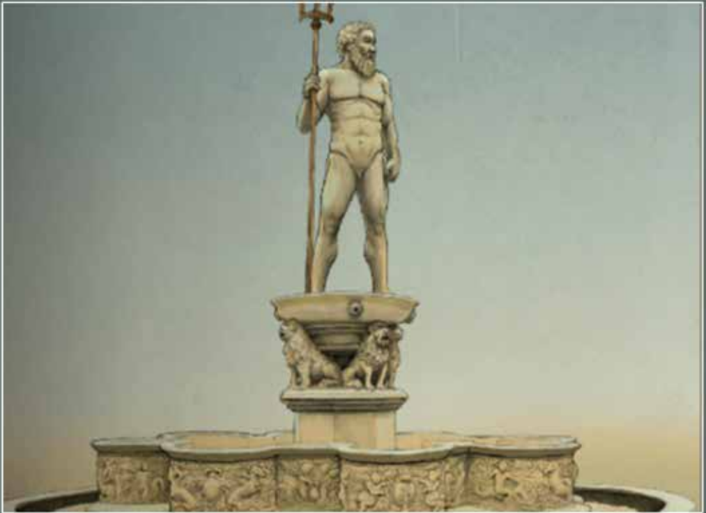
Η παλιά απεικόνιση της Κρήνης Morozini Ηράκλειο- Ελλάδα