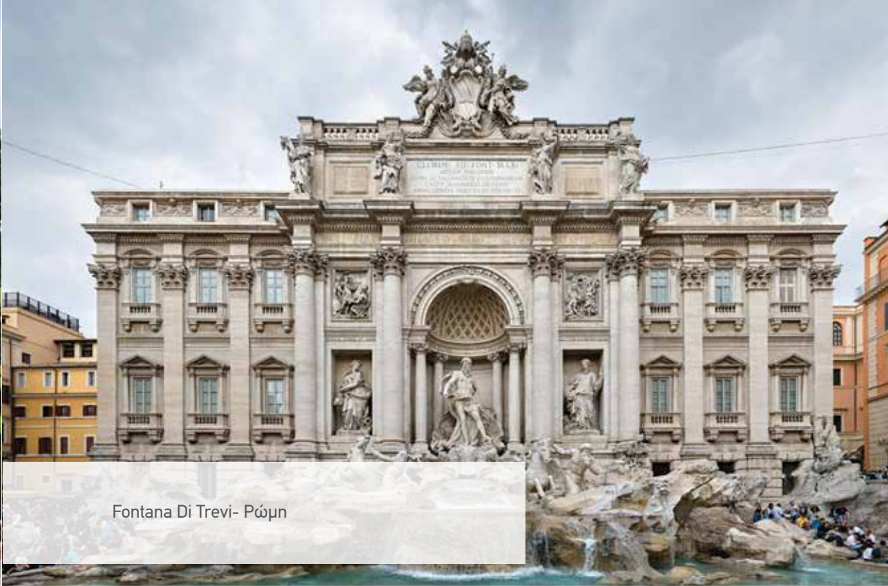
Fontana Di Trevi- Ρώμη