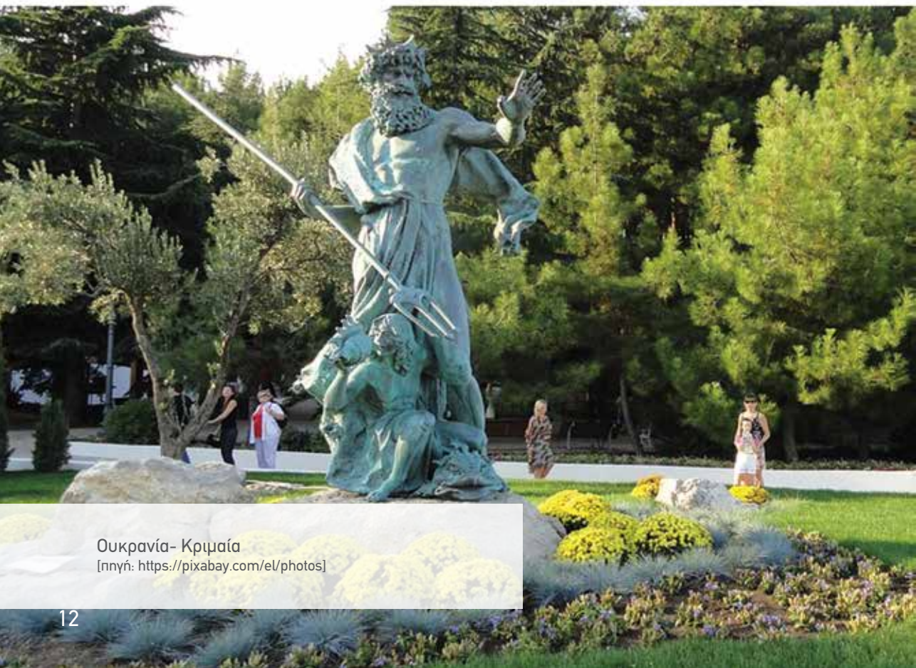
Ουκρανία- Κριμαία