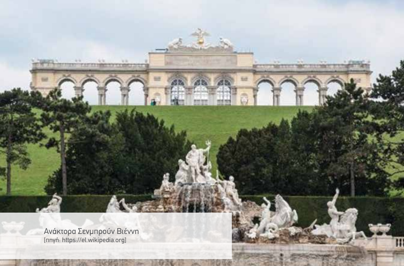
Ανάκτορα Σενμπρούν Βιέννη