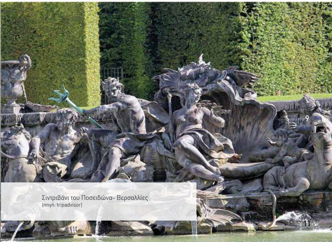
Σιντριβάνι του Ποσειδώνα- Βερσαλλίες